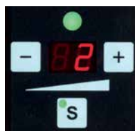
Bandspanning eenvoudig instelbaar met één drukknop