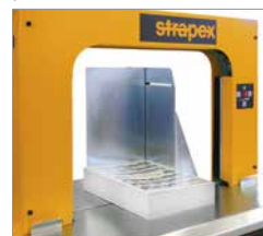
Pakketaanslag voor exacte positionering van losse pakketten