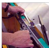
Onderhoud zonder gereedschap