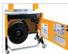
Robuste, compacte constructie