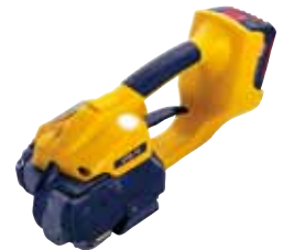
Op accu werkend apparaat